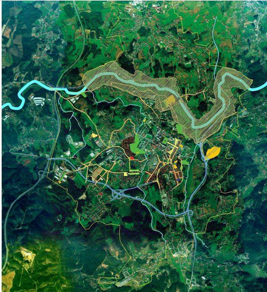
Fig.5 – Plano das Margens do Ave, St.Tirso, planta de localização. A Fábrica do Teles é o polígono amarelo localizado dentro de perímetro do plano.