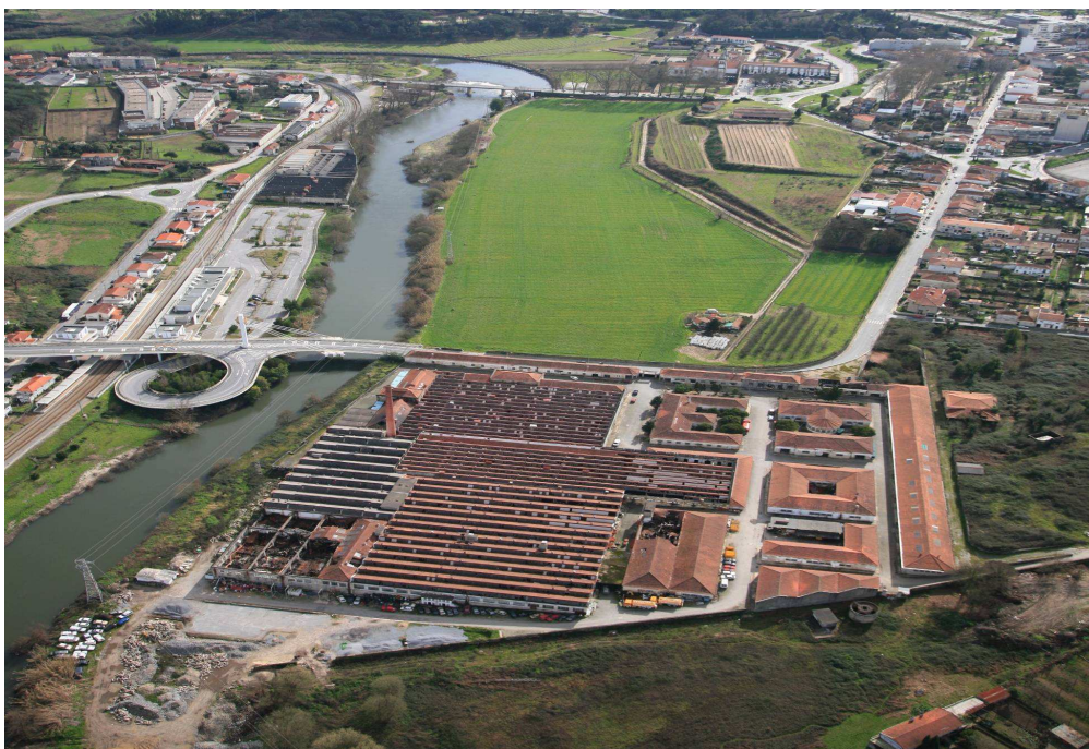
Fig. 4 – Fábrica do Teles, estado actual ((foto Filipe Jorge, Portugal Visto do Céu, Ed. Argumentum, Lisboa, 2007)