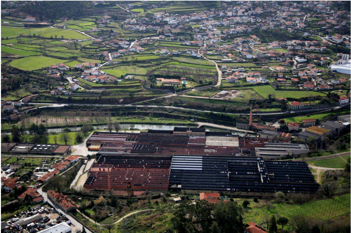
Fig.2 – Edifício fabril abandonado; Fábrica do Rio Vizela, Vila das Aves, St.º Tirsó