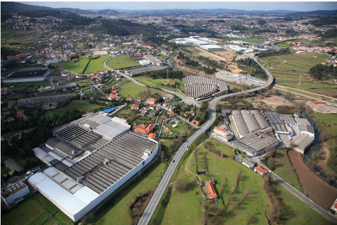
Fig.1 Paisagem industrial do Vale do Ave